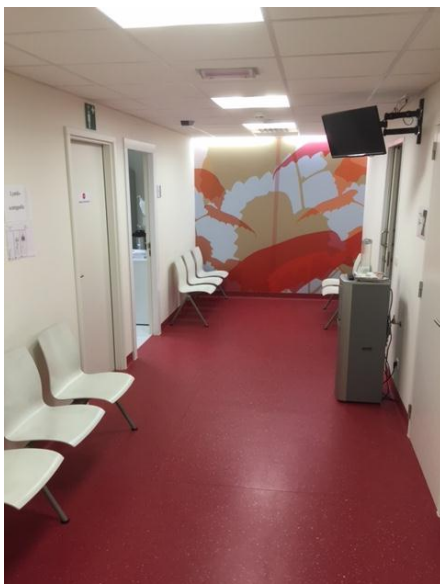
Wachtzaal geïnjecteerde patiënten